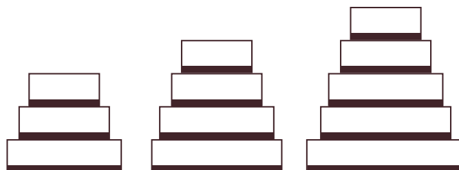
ŚREDNICE PIĘTER PREMIUM PLUS 220-250 porcji